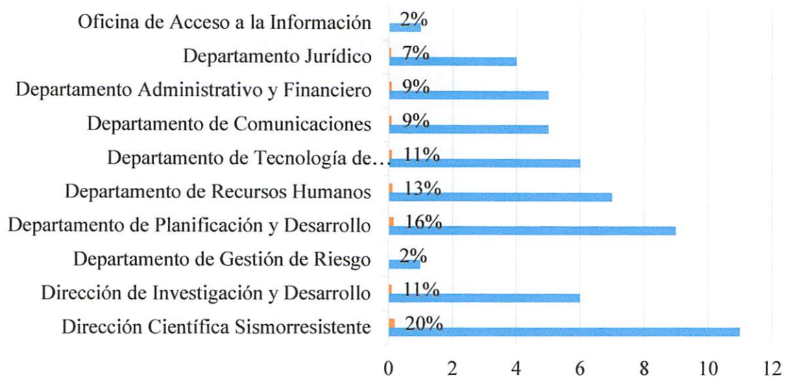
Gráfico de productos de cumplimiento por área

Se observa que la mayoría de los productos corresponden al área misional, la cual está compuesta por las Dirección Científico Sismorresistente, Dirección de Investigación y Desarrollo y el Departamento de Gestión de Riesgo con un total de 33%, continuándole Planificación y Desarrollo con 16%, Recursos Humanos 13%, Tecnología con 11%, Administrativo y Financiero 9%, Comunicaciones con 9% y jurídico con 7%. Para una suma del 100% de todos los productos con sus respectivas actividades.